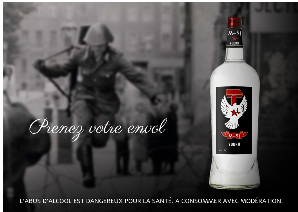
Affiche sur le passage à Checkpoint Charlie - Horizontale