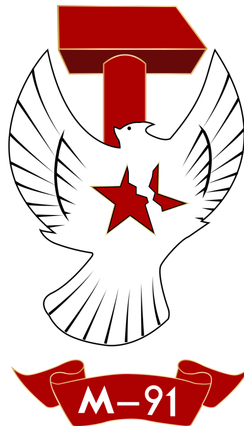
Utiliser la version fond noir sur fond blanc