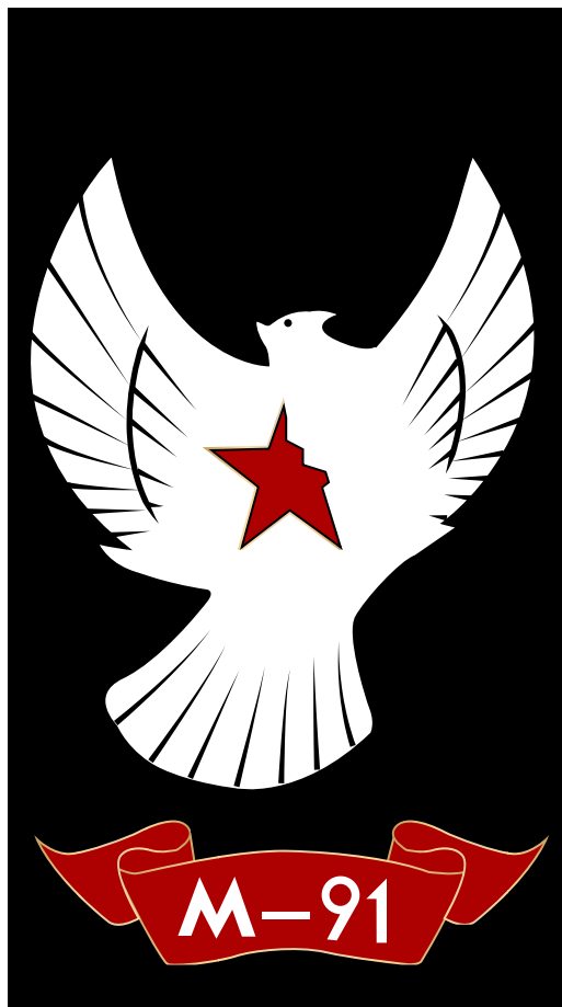
Retirer/Ajouter des éléments

Quelques interdits pour ce logo, voici la liste.