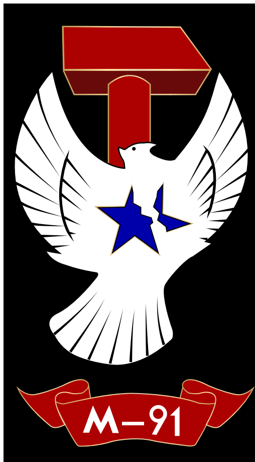
Changer les couleurs