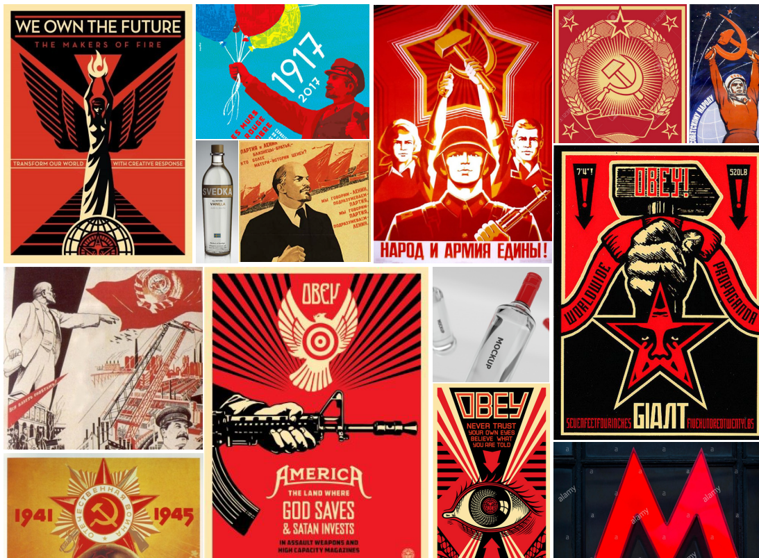
Planche tendance (MoodBoard)

Enfin, cette formulation en lettre suivie de chiffres rappelle la nomination d'une arme. Une façon de mettre en avant la force de cette vodka.