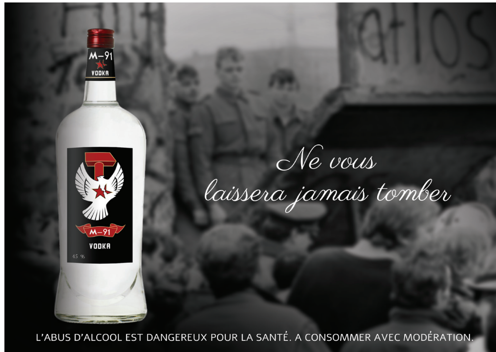
Affiche sur la chute du mur de Berlin - Horizontale

Cette campagne d'affiche est basé sur les événements relatifs au mur de Berlin, événement majeur dans la chute de l'URSS. Cette campagne joue sur les jeux de mots. On peut imaginer une série de campagne sur différents événements et sur la culture soviétique (conquête spatiale,....)