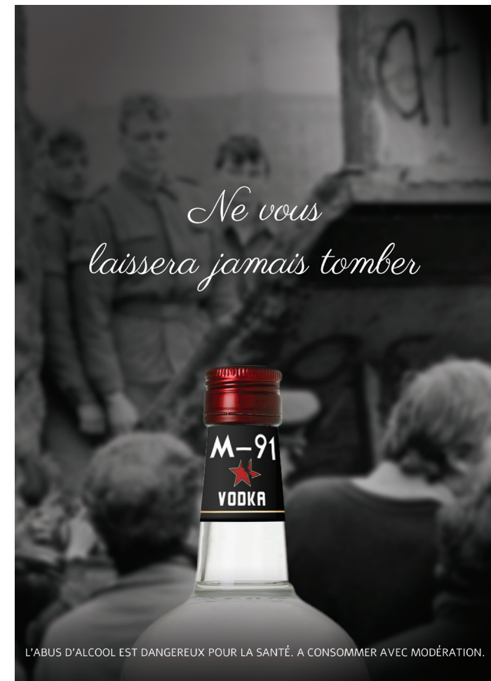
Affiche sur la chute du mur de Berlin - Verticale