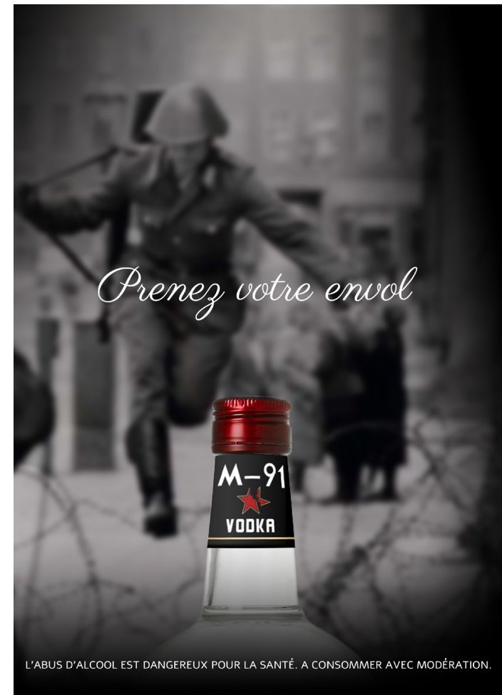
Affiche sur le passage à Checkpoint Charlie - Verticale